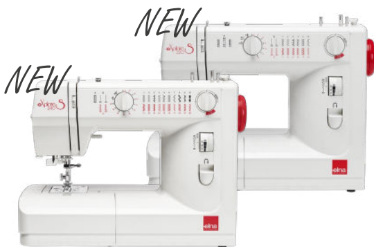
eXplore 240S & 220S