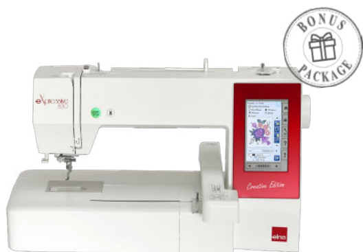
eXpressive 830 Creative Edition

Die gesamte eXpressive-Palette ist für hochwertige Stickereien konzipiert und kombinieren Sticktechnik mit Nähfunktionen in hervorragender Qualität. Mit den technischen Möglichkeiten dieser Topmodelle werden Sie Ihre kreativen und handwerklichen Fertigkeiten weiterentwickeln.