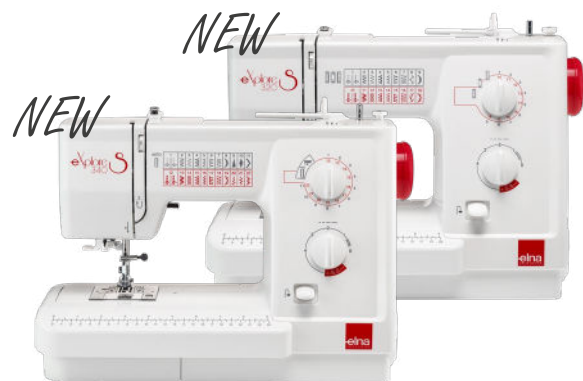
eXplore 340S & 320S