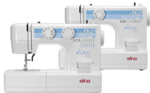
eXplore 160 & 150