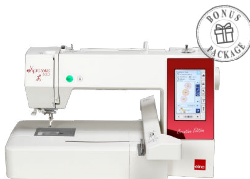
eXpressive 830L Creative Edition

Sticksoftware eXuberance Junior inklusive